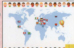
「世界の民謡巡りツアー」